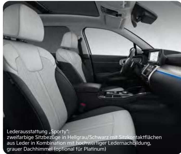
Lederausstattung „Sporty“: zweifarbige Sitzbezüge in Hellgrau/Schwarz mit Sitzkontaktflächen aus Leder in Kombination mit hochwertiger Ledernachbildung, grauer Dachhimmel (optional für Platinum)