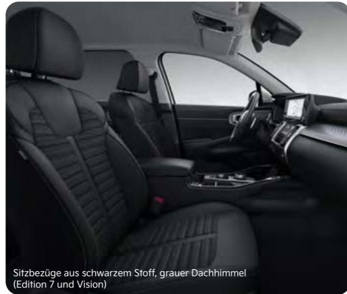
Sitzbezüge aus schwarzem Stoff, grauer Dachhimmel (Edition 7 und Vision)