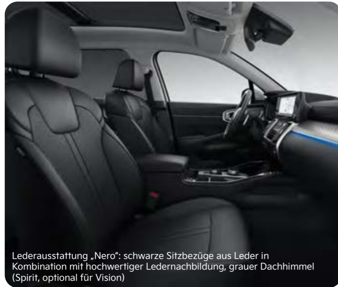
Lederausstattung „Nero“: schwarze Sitzbezüge aus Leder in Kombination mit hochwertiger Ledernachbildung, grauer Dachhimmel (Spirit, optional für Vision)