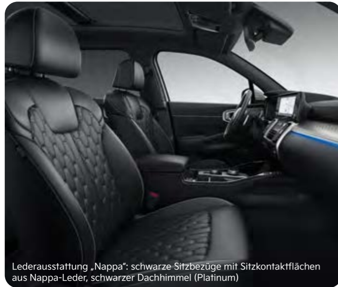
Lederausstattung „Nappa“: schwarze Sitzbezüge mit Sitzkontaktflächen aus Nappa-Leder, schwarzer Dachhimmel (Platinum)

Der Kia Sorento zeigt sich im Interieur ebenso elegant und stilvoll wie im äußeren Auftritt. Das Ausstattungsspektrum beinhaltet neben hochwertigen schwarzen Stoffsitzen drei verschiedene Ledervarianten: in Schwarz, zweifarbig in Schwarz-Hellgrau sowie in Schwarz mit Sitzkontaktflächen in Nappa-Leder.